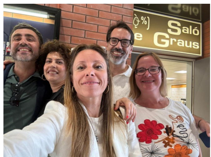
Editor y alguno de los colaboradores del libro