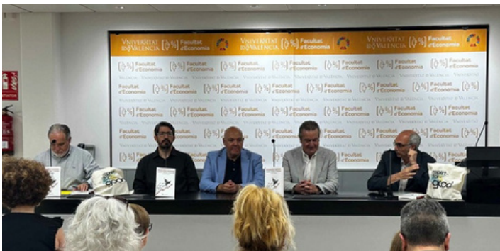
Presentación del libro en la Facultad de Economía de la Universidad de Valencia