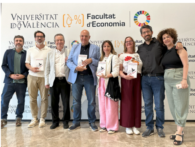
Autor, editor y alguno de los colaboradores